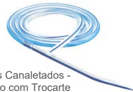
Drenos Canaletados - Redondo com Trocarte