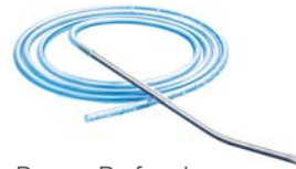
Drenos Perfurados - Redondo com Trocarte